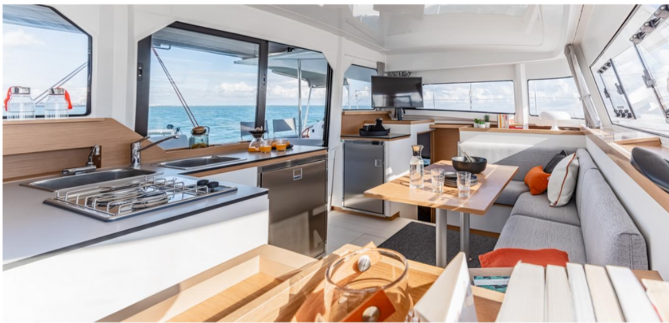
Excess 11 - Merlion (Singapore)