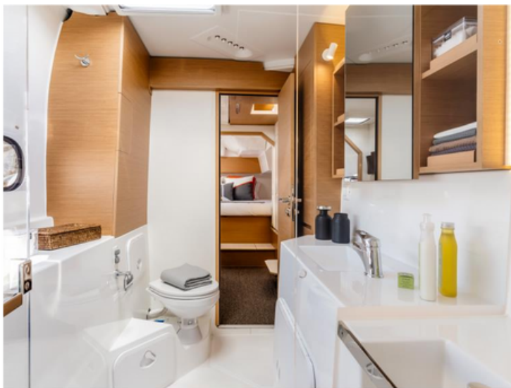
Excess 11 - Merlion (Singapore)