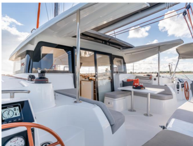
Excess 11 - Merlion (Singapore)